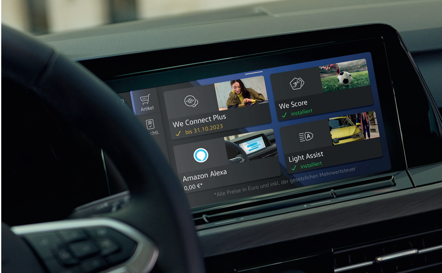
Bild zeigt beispielhafte Darstellung des In-Car Shops im Golf.